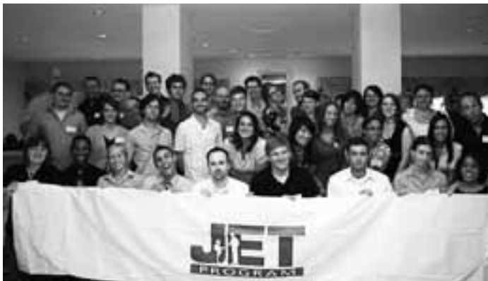
デトロイトから日本に出発したJET青年(総領事公邸での出発前レセプションにて)

今年のJETプログラムでは、8月1日に41名、8月24日に3名の米国人青年が、デトロイトから日本に旅立ちました。